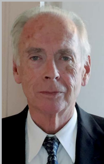
Құрметті лорд Хескет, Британия империясы орденінің Рыцарь-Командоры, Ұлы Мәртебелі құпия кеңесінің мүшесі

Халықаралық аудиторлық тексерулерден өтіп, жылды сәтті аяқтаған, соның арқасында техникалық қызмет көрсету бойынша өз қызметтерінің спектрін кеңейтуге және оларды басқа әуекомпанияларға ұсынуға мүмкіндік алған «Эйр Астана» әуекомпаниясы үшін қауіпсіздік аспектісі оның барлық қызметінің басымдығы болып қала береді.