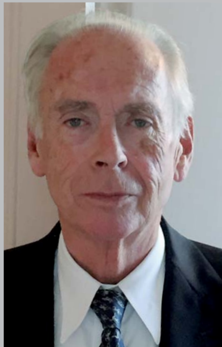
Достопочтенный лорд Хескет, Рыцарь-Командор ордена Британской империи, член Тайного совета Ее Величества

Безопасность остается приоритетом всей деятельности авиакомпании «Эйр Астана», которая успешно завершила год, пройдя международные аудиторские проверки, что позволяет ей расширять спектр своих услуг по техническому обслуживанию и предлагать их другим авиакомпаниям.